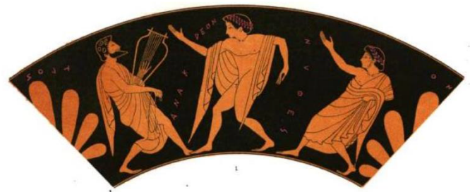
Ερυθρόμορφη κύλικα που εμφανίζει τον λυρικό ποιητή Ανακρέοντα και δυο νέους να χορεύουν.

Αναγεννησιακή μουσική σε αρχαίους ελληνικούς και αγγλικούς στίχους