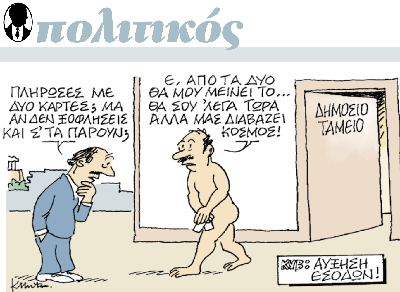
ΤΟΥ ΚΩΣΤΑ ΜΗΤΡΟΠΟΥΛΟΥ

Σημειώνεται ότι σύμφωνα με τον προγραμματισμό της Διάσκεψης των Προέδρων, το προσχέδιο του προϋπολογισμού θα συζητηθεί στην Επιτροπή Οικονομικών Υποθέσεων σε τρεις συνεδριάσεις στις 19 και 20 Οκτωβρίου. Οπως είπε χθες ο Πρόεδρος της Βουλής, αναμένονται ακόμη τα νομοσχέδια για το πλαστικό χρήμα και τα αδύλωτα εισοδήματα καθώς και για την κοινωνική οικονομία, όπως έχει προαναγγείλει ο Αλέξης Τσίπρας.