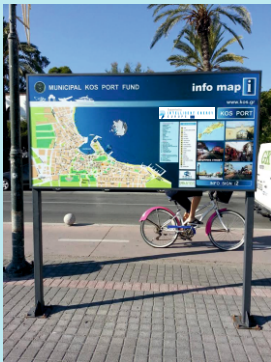
Figure 2: Information sign