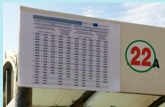
Εικόνα 3: Τα αναθεωρημένα δρομολόγια των γραμμών 1 και 5

Το καλοκαίρι του 2014, τα δρομολόγια δύο γραμμών της δημοτικής συγκοινωνίας (1 και 5, που συνδέουν τις μεγάλες ξενοδοχειακές μονάδες των περιοχών Ψαλίδι και Άγιος Φωκάς με την πόλη της Κω) αναθεωρήθηκαν προκειμένου να προσαρμοστούν στις ανάγκες μετακίνησης των τουριστών (Εικόνα 3).