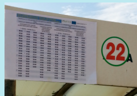
Figure 3: New schedules of lines 1 and 5

In summer 2014, the schedules of two municipal public transport lines (1 and 5, which connect the city of Kos with major hotels in the areas Psalidi and Aghios Focas) were modified in order to adjust to the mobility needs of tourists (Figure 3).