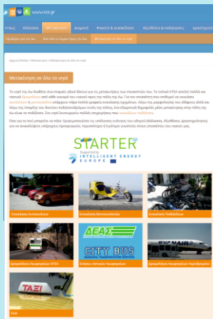
Εικόνα 1: Ο διαδικτυακός τόπος PORTAL

Το καλοκαίρι του 2013 αναπτύχθηκε ένας ολοκληρωμένος τουριστικός οδηγός (PORTAL). Πρόκειται για τον επίσημο διαδικτυακό τόπο της Κω (Εικόνα 1), ο οποίος περιλαμβάνει μεταξύ άλλων υπηρεσίες για την υποστήριξη της κινητικότητας των τουριστών, όπως διαδρομές προς σημεία τουριστικής έλξης, προτεινόμενες ποδηλατικές διαδρομές και σχεδιασμό διαδρομών. Το PORTAL παρέχεται και ως εφαρμογή κινητού τηλεφώνου στις πλατφόρμες Android, iOS και Windows Mobile).