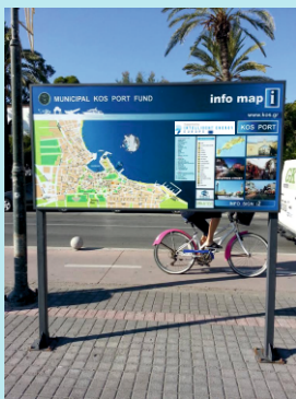
Εικόνα 2: Πινακίδα ενημέρωσης